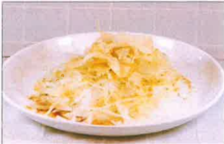
オニオンスライス