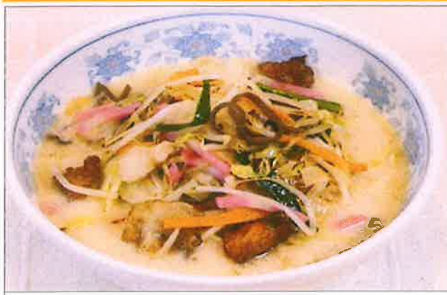
黒豚野菜ちゃんぽん ¥1,320