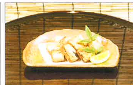
カツオ腹皮の唐揚げ