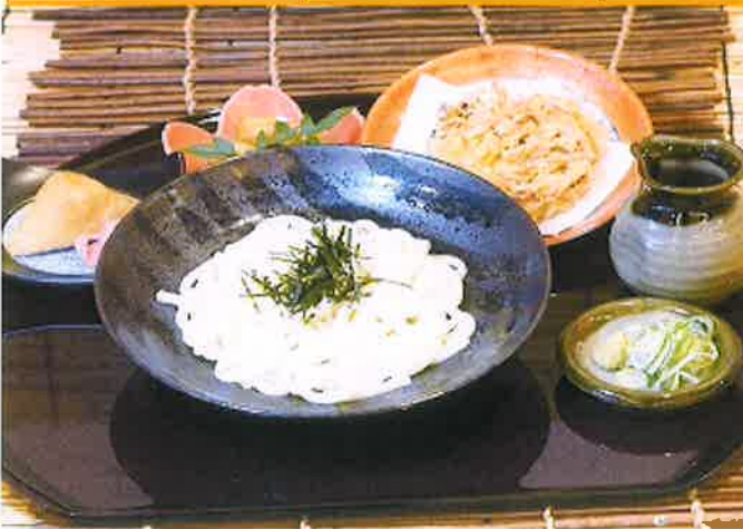
野菜かきあげぶっかけうどんセット