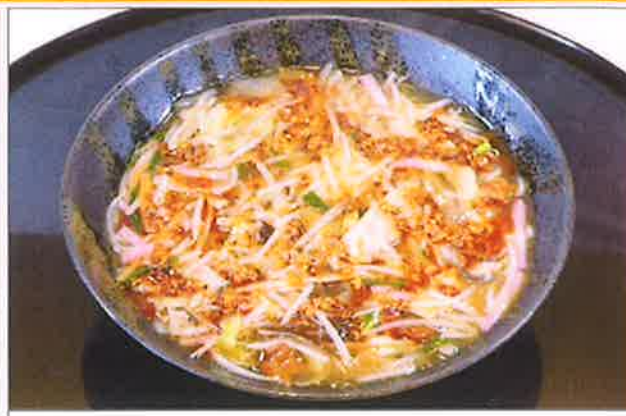
旨辛黒豚中華そば ¥1,490

地鶏ガラにオイスターの旨味をプラス したあんかけに特製ラー油とガーリック がクセになる！生麺使用！ よく混ぜてお召し上がりください。