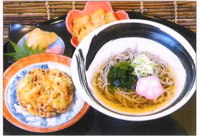
野菜かきあげそばセット