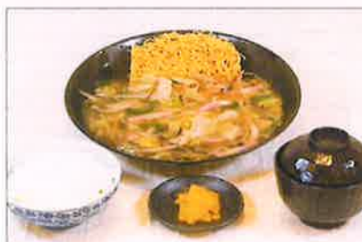
黒豚皿うどん セット