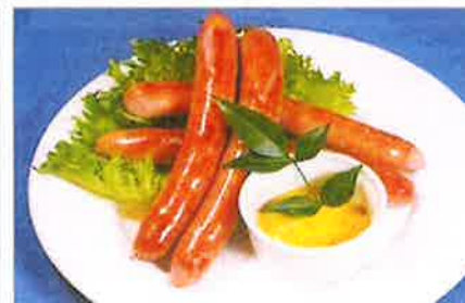
粗挽きロングウインナー