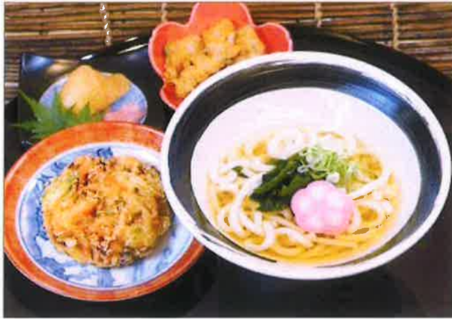
野菜かきあげうどんセット