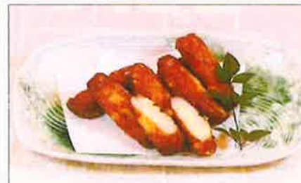
薩摩揚おさつ棒天