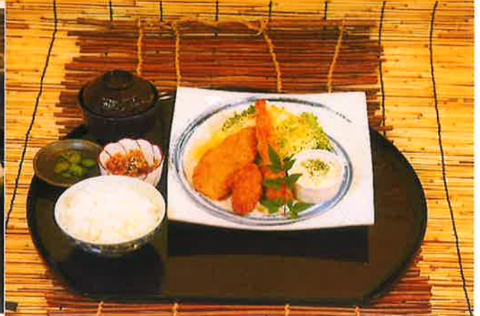
ぶしぶし鶏天御膳 New ¥1,790