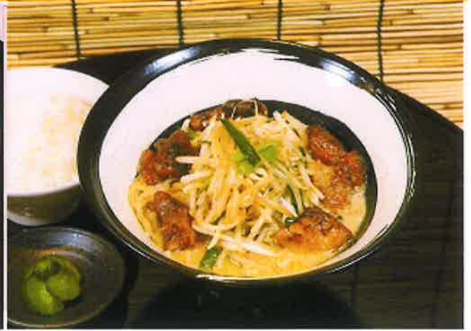
牛ホルモン旨味噌らぁ麺セット

豚骨と鯉節から取ったコクがありながら あっさりとした出汁に黒糖と焼酎で とろとろに煮込んだ黒豚軟骨をトッピング！