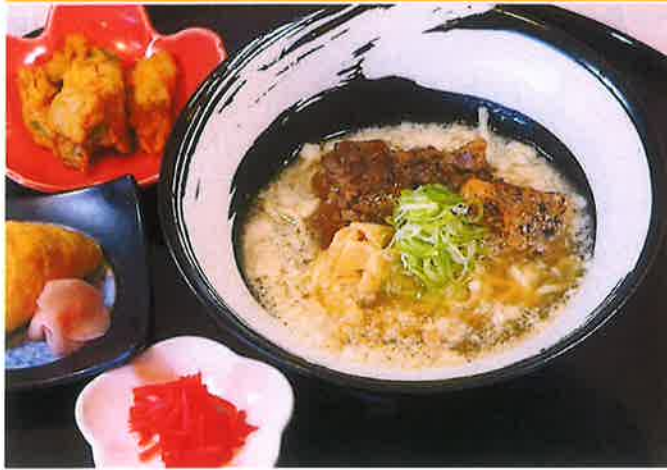
黒豚軟骨生ちぢれ麺セット