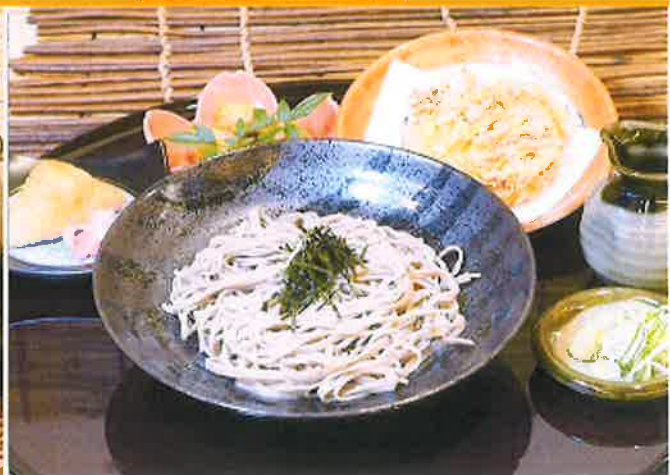
野菜かきあげぶっかけそばセット