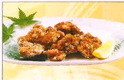
味噌牛ホルモンの唐揚げ