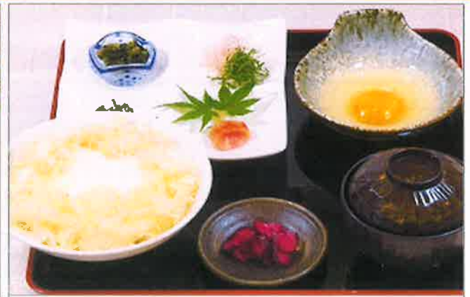
卵かけ御飯薬味セット ¥1,190

酒の肴に御飯のお供に厳選したこだわりの 彩り珍味！！ ※季節入荷状況により内容が異なります。