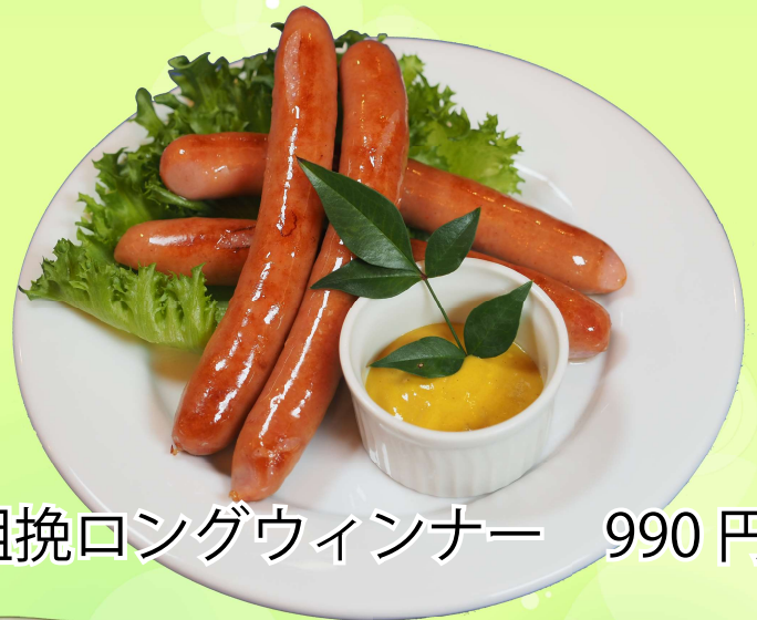
粗挽ロングウィナー