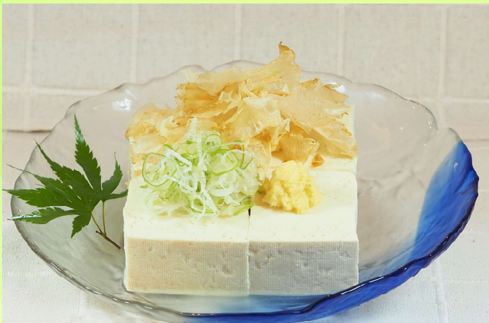
冷奴 650円 湯豆腐 (期間限定)