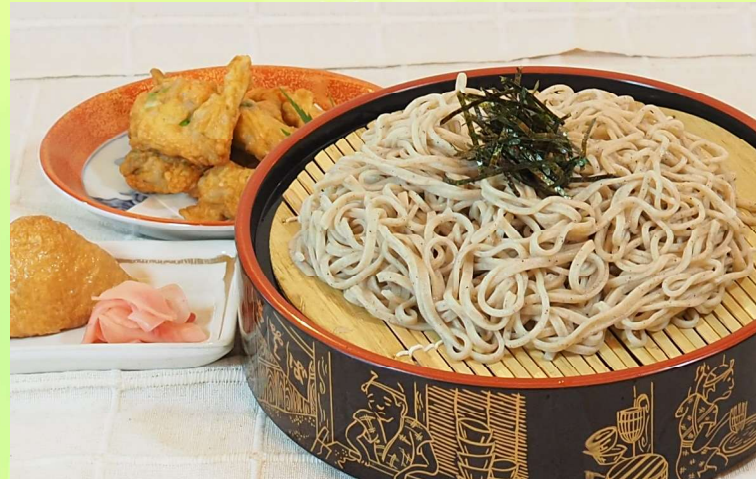
ざるうどん・そばセット 1,320円