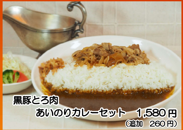
黒豚とろ肉 あいのりカレーセット 1,580円 (追加 260円)