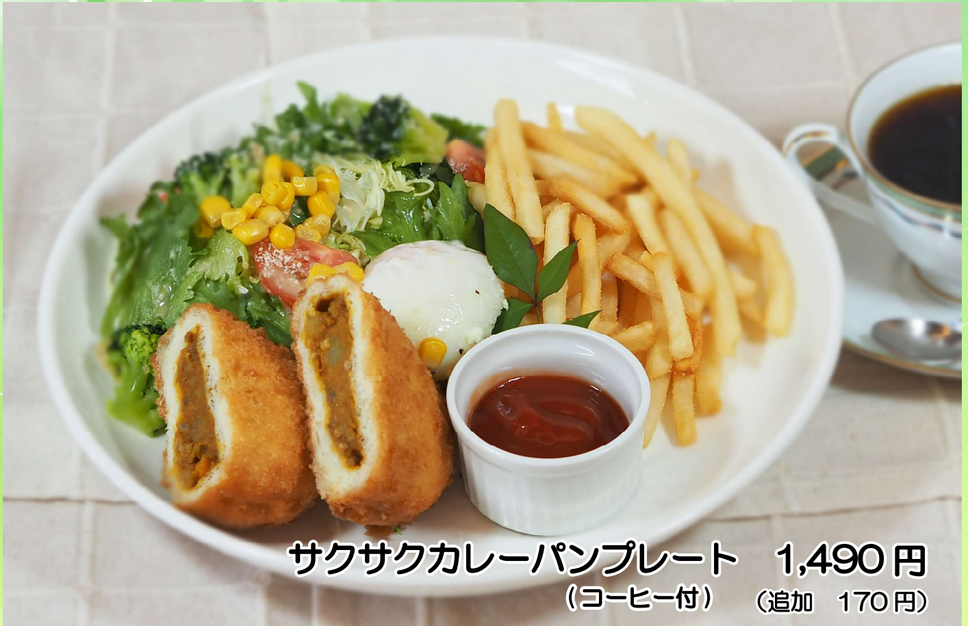
サクサクカレーパンプレート 1,490円 (コーヒー付) (追加 170円)