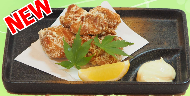
若鶏唐揚げ 990 円