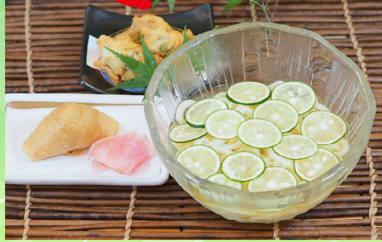
冷やしすだちうどん・そばセット 1,490円 食事付プランは追加 170円