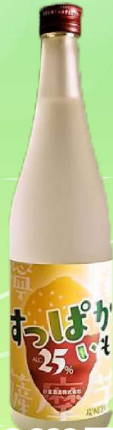
すっぱかいも 四合

黒麹仕込み特有の深く甘い香りの中に、爽快さが広がる奥深い香りがします。芋の味わいが、じわじわとせまり笑顔になれます。