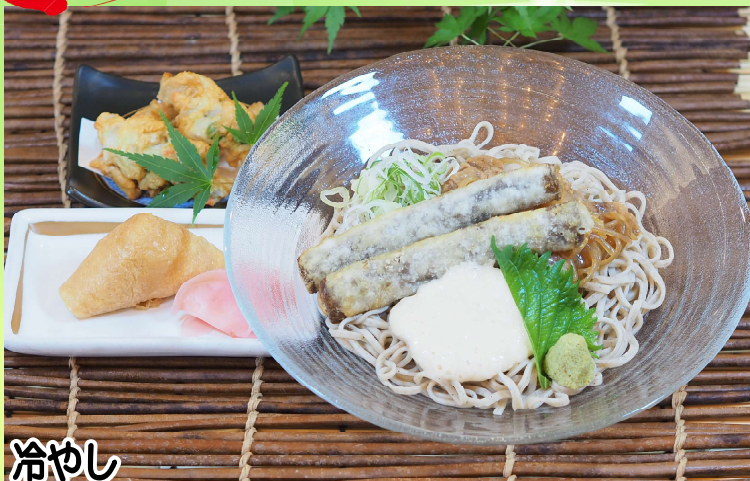
冷やし 黒豚トロ肉ゴボウうどん・そばセット 1,550円 食事付プランは追加 230円