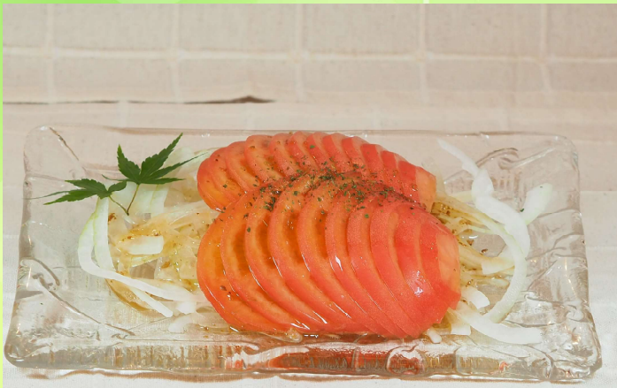
トマトスライス 750円