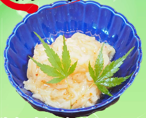
生帆立酒盗和え 680 円