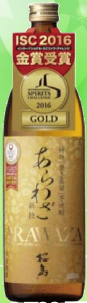
あらわぎ桜島五合