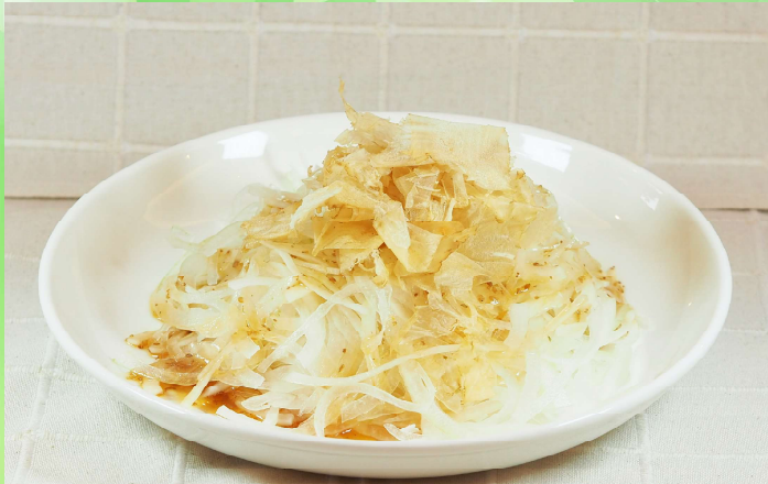
オニオンスライス 750円