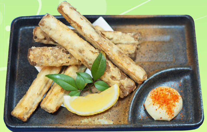
国産極太ごぼう唐揚げ