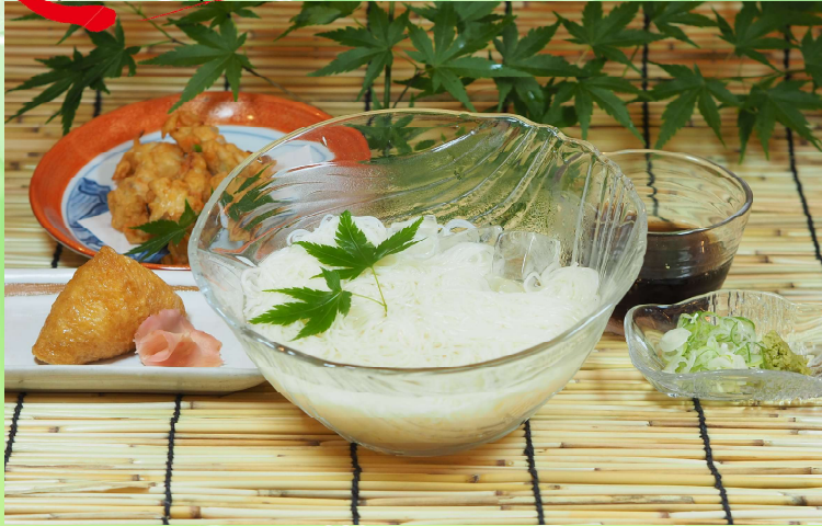
冷やし素麺セット 1,320円